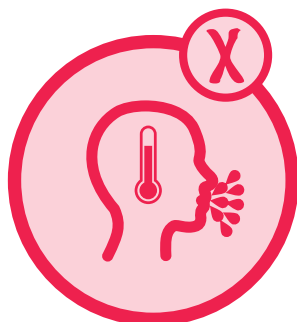
Bei Symptomen: Zuhause bleiben!