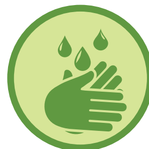
Händehygiene, Husten- und Niesetikette beachten!